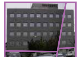
三次元（4枚の可視画像を使用）

上記のような二次元の弱点を解消したのが三次元赤外線診断法です！二次元と同じ距離から撮影した場合、写真枚数が減るため 作業量を4割削減 できます（当社比）。しかし、診断には知識や経験が必要です。その 手助けとなるソフトが「建視朗」 なのです！さらに「建視朗」では、カメラ校正が可能のため、 お手持ちのデジタルカメラを使用 できます。