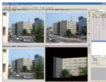
三次元化ツール 使用例