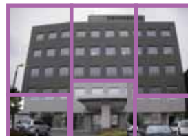
二次元（6枚の可視画像を使用）