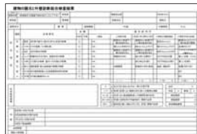
外壁診断報告書 作成例