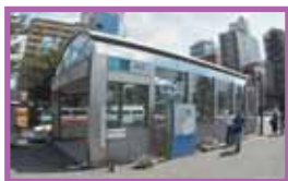
歪みの補正前（二次元）

二次元法 ：二次元の写真は、画面外側の歪みが大きいいため撮影範囲を小さくし精度を上げます。このため撮影枚数が増えます。写真枚数を減らすには遠距離から撮影します、遠距離の写真は精度が低下します。建物周囲に障害物があると遠距離写真は撮影できませんし、歪みがあるため、基本的に貼り合わせて使用することが難しいです。建物の一面(東西南北各々)の全体写真を用意しないと、劣化損傷位置の判別しにくいです。局所的な写真では正確な位置がわからず経年劣化の判定はできません。また、仕上げや形状が似ている団地等で一度に複数棟調査するにも不向きです。