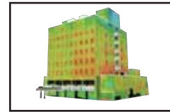
三次元赤外線画像

デジタルカメラで撮影した画像を数値化（ベクトルデータ化）し、制作「建視朗」を使用し貼り合わせ三次元化します。さらに、赤外線カメラで撮影した画像を貼り合わせ、浮き・剥離・密着不良等の劣化を判定します。この際、「建視朗」のレポート作成ツールを利用すると損傷の正確な位置を把握し、容易に報告書等を作成できます。